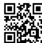
「観音寺Web商店街」QRコード

また、個店の情報だけでなく、商店街のイベント情報やインターネットショッピング機能もあり、自宅にいなから観音寺の商店街で買い物を楽しんでいただけるようになっています。