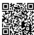
「今宵もはじまりました」QRコード