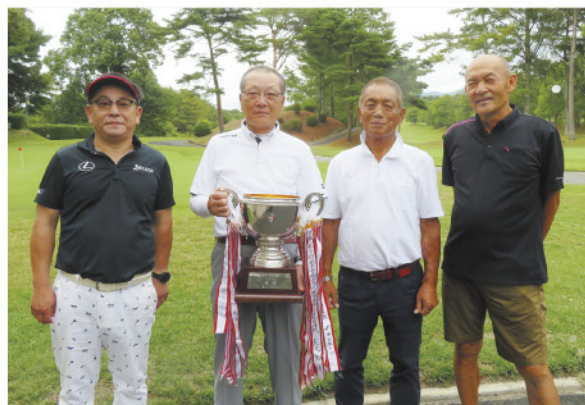
団体優勝 KGC ①様